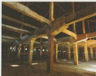
> Étage des femmes et des enfants internés