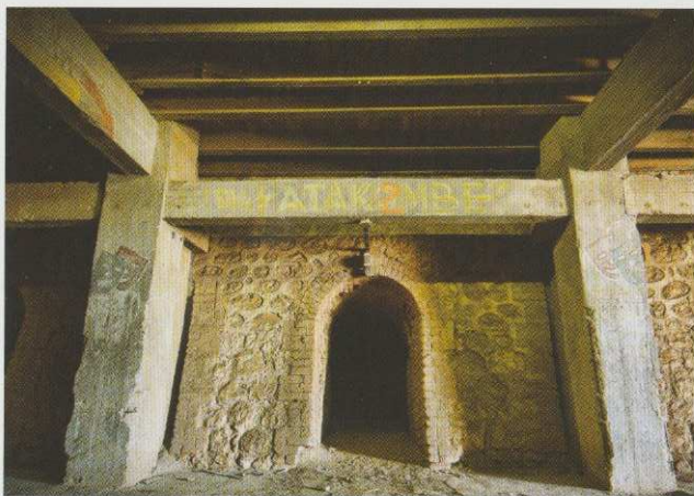
> "Die Katakombe", four à tuiles devenu refuge de la vie culturelle au camp, du nom d'un cabaret contestataire de Berlin avant le nazisme