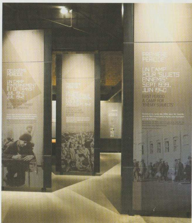
> Volet Historique - Les "trois périodes du Camp des Milles"