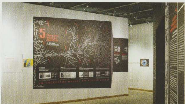
> Panneau récapitulatif des résistibles engrenages pouvant mener au pire

Le Volet Réflexif prend fin devant un "Mur des Actes justes" qui montre la variété des actes de résistance et de sauvetage possibles et la grande diversité des hommes et des femmes qui nous ressemblent et qui ont su réagir efficacement, chacun à sa manière.