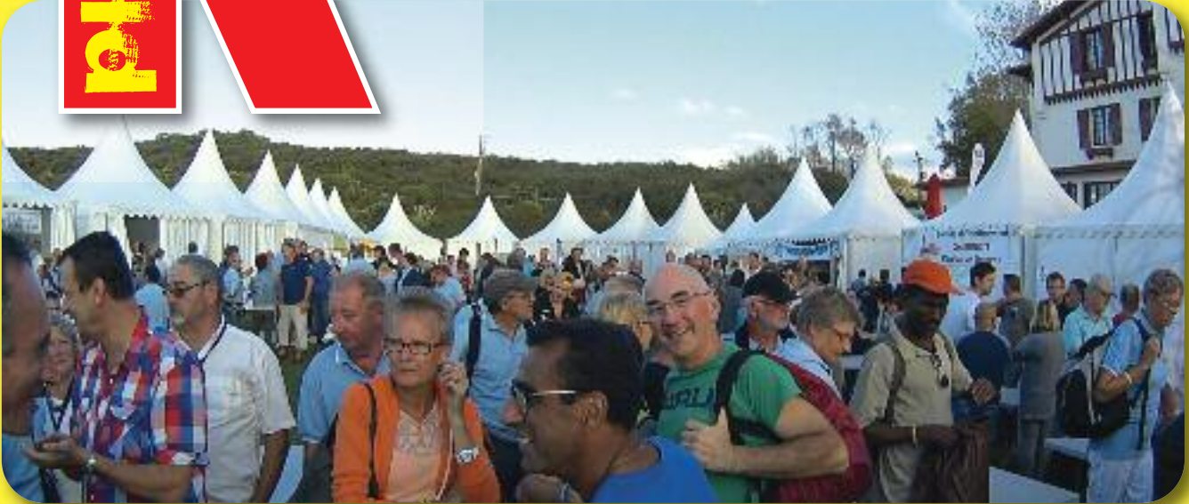
Fête CE - CCGPF

Information Communication C.E. Cheminots PACA