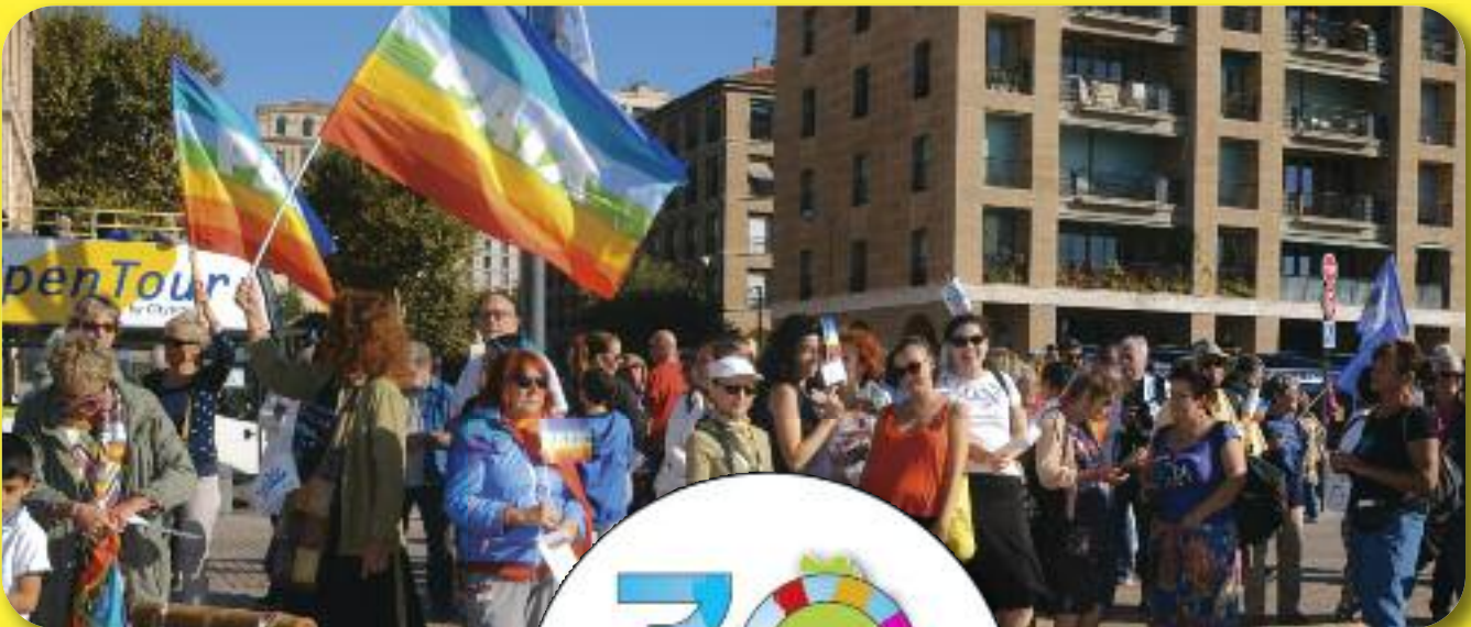
Les voiles de la Paix