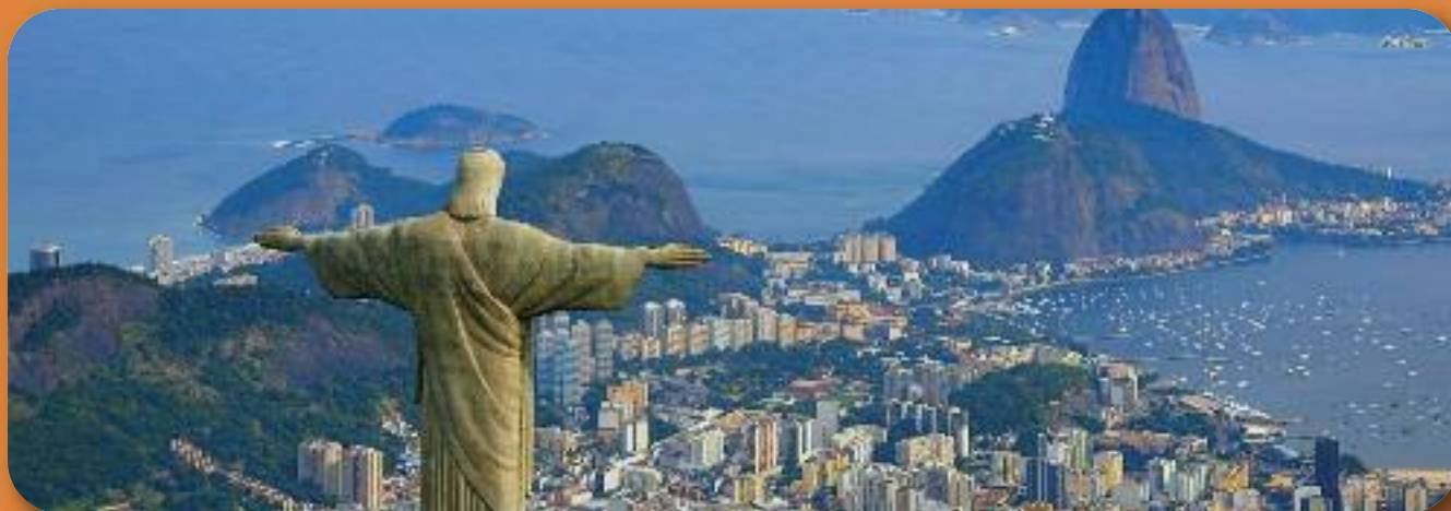
Séjour solidaire au Brésil