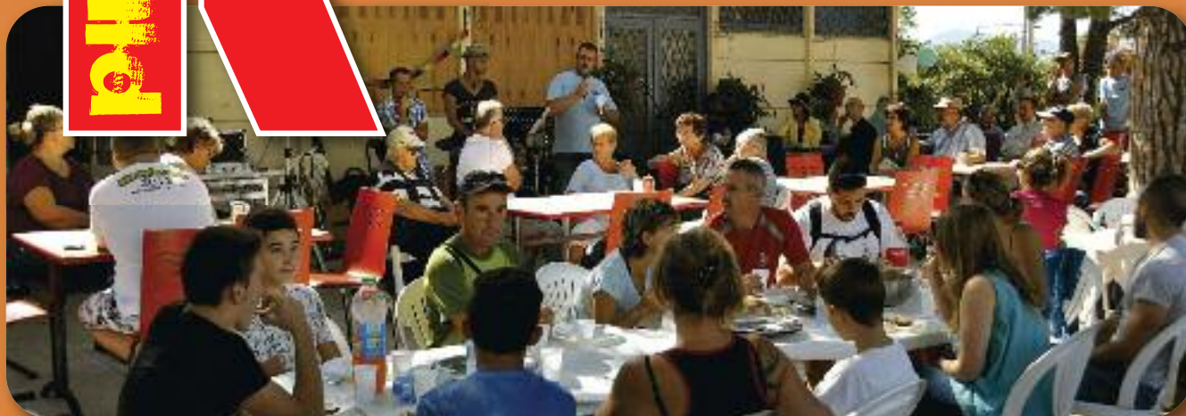
Focus sur vos Antennes CE

Information Communication C.E. Cheminots PACA