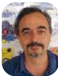
Par Gilles Ciantar Responsable Communication

Des rencontres seront programmées avec les habitants de l'île pour vivre des moments sincères et riches en enseignement.