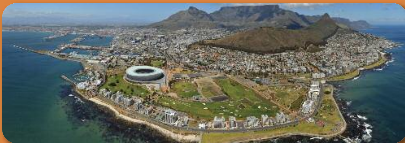
2 Séjours en Afrique du Sud