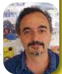
Par Gilles Ciantar Responsable Communication

Tout enfant a un droit inhérent à la vie et l'État a l'obligation d'assurer la survie et le développement de l'enfant.