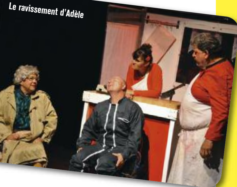
Le ravissement d'Adèle