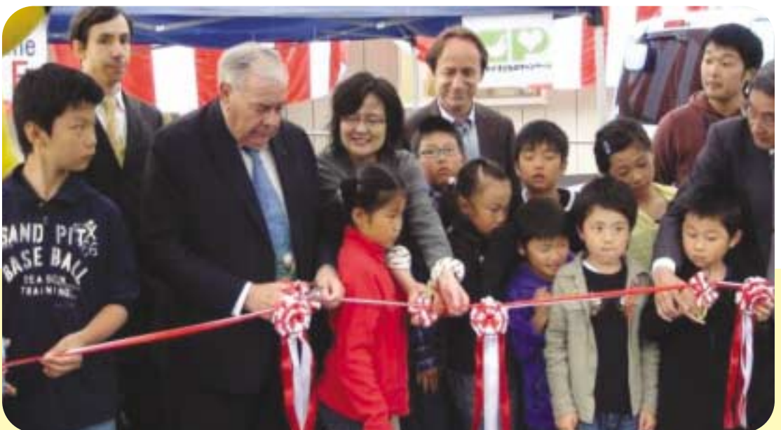
Inauguration de la Maison de l'Enfance - 27 mai 2012

Il s'agira de participer à la création d'un espace ludique et culturel pour les jeunes.