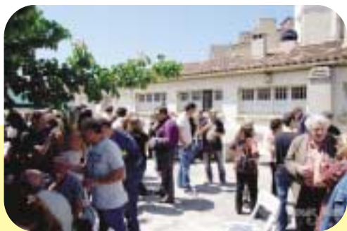
La journée du 24 mai

Comme dans les autres médiathèques, elles assurent le conseil lecture et l'inscription aux activités proposées par le CE. L'une d'elles s'occupe de la gestion des CD audio pour la région.