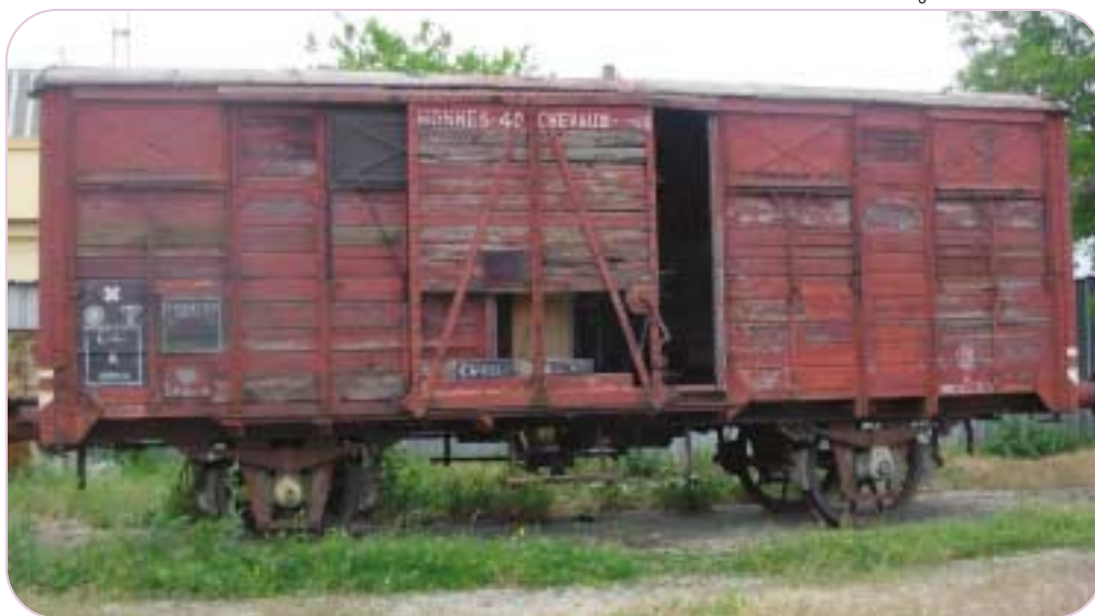
Le wagon de Miramas