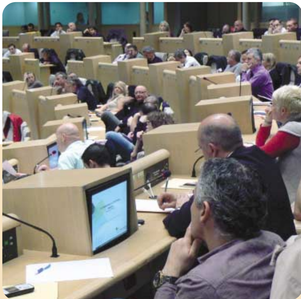
Les assises de la fraude

Bien évidemment, vous serez informés de la progression ou du résultat de ces études, notamment par la diffusion du journal Flash Éco inséré dans le Rail +. La conclusion de l'étude sur la fraude a fait l'objet d'un colloque le 23 mars 2012 dans les locaux du Conseil régional.