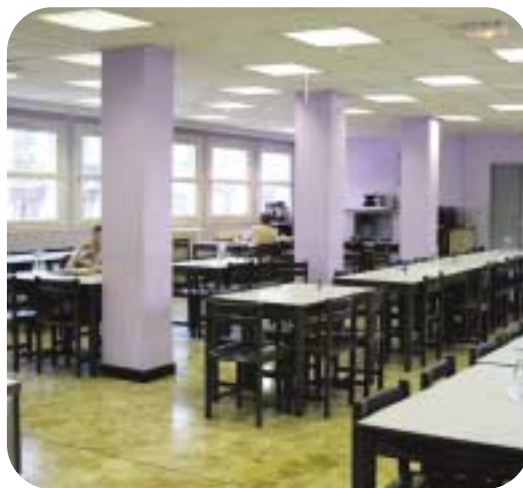
Restaurant de Nice

Pour autant nous devons rester vigilants sur les cheminots « transférés » dans d'autres CE (Clientèles par exemple). Cette vigilance doit porter sur 2 points : l'influence sur les futures dotations ainsi que sur l'égalité de traitement.