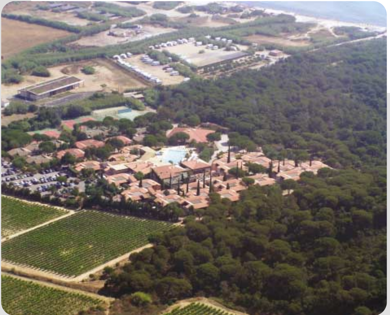
Village Vacances de Ramatuelle

En effet, en plus des départs faits avec le CCE, ce ne sont pas moins de 5168 personnes qui ont pu bénéficier des structures dans lesquelles le CE PACA a investi.