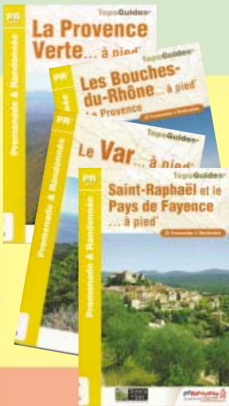
Quelques livres pour les randonnées dans notre région

Conçus de la même manière, ces guides proposent plusieurs randonnées pour découvrir les paysages, la diversité des espèces animales et végétales. Chaque circuit indique la longueur, le temps de marche et le niveau de difficulté. Ils sont accompagnés de cartes.