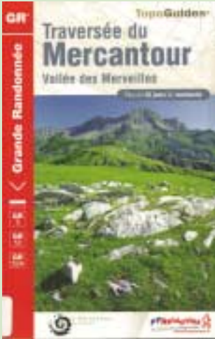
L'été et des idées de voyages et de découvertes